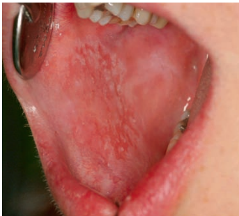
Abbildung 5: Wangenschleimhaut eines Patienten mit Morbus Crohn mit hyperplastischen und erosiven Arealen

Anzahl von Campylobacter rectus (ehemals Wolinella recta) nachgewiesen und eine mit diesem Mikroorganismus assoziierte, verringerte neutrophile Chemotaxis festgestellt. In unserer Arbeitsgruppe wurden in den subgingivalen Plaqueproben von 149 Patienten mit MC erhöhte Prävalenzen von Aggregatibacter actinomycetemcomitans (76,9 Prozent), Porphyromonas gingivalis (62,6 Prozent), Prevotella intermedia (79,6